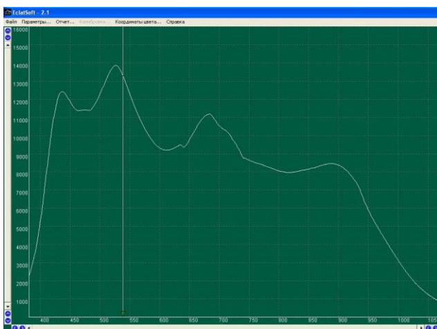
Рис. 1. Вид сигнала в диапазоне 380-1100 нм

Сама же ССК должна обеспечивать учет собственных шумов диодной линейки и одновременно обеспечивать высокую стабильность базовой линии. С помощью ССК,